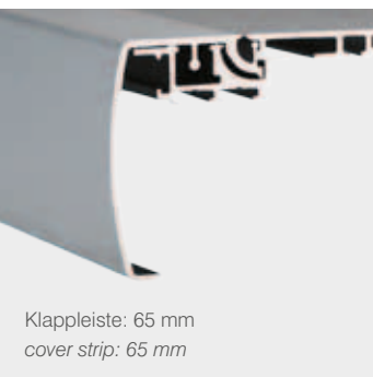
Klappleiste: 65 mm cover strip: 65 mm