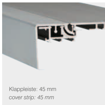
Klappleiste: 45 mm cover strip: 45 mm